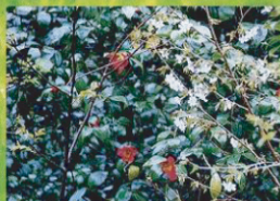
⑭ ユキツバキとオオヤマザクラ